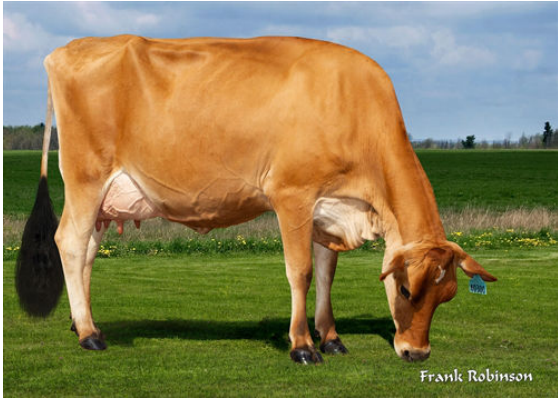
JX VIERRA PRESLEY {6} DAM

JX RIVER VALLEY CHIEF {6} JX VIERRA PRESLEY {6} VG-86%-4YR-USA CDF VICEROY JX OAK LANE EUSEBIO ERICA {5} VG-87%-4YR-USA JX FARIA BROTHERS EUSEBIO {4} OAKLANE CHISEL DELLA 2130 VG-85%-5YR-USA